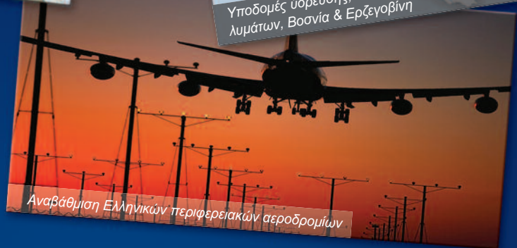
Αναβάθμιση Ελληνικών περιφερειακών αεροδρομίων