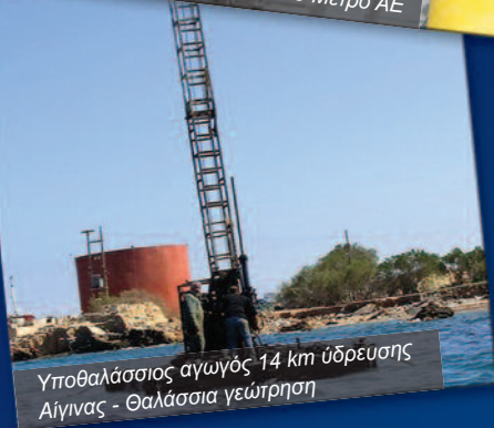
Υποθαλάσσιος αγωγός 14 km ύδρευσης Αίγινας - Θαλάσσια γεώτρηση