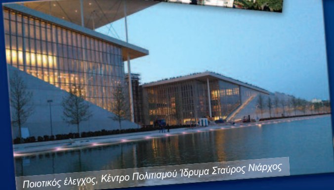
Ποιοτικός έλεγχος, Κέντρο Πολιτισμού Ίδρυμα Σταύρος Νιάρχος