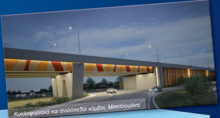
Κυκλοφοριακά και ανισόπεδο κόμβοι, Μπιτσουάνα