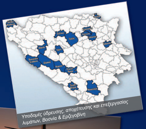
Υποδομές ύδρευσης, αποχέτευσης και επεξεργασίας λυμάτων, Βοσνία & Ερζεγοβίνη