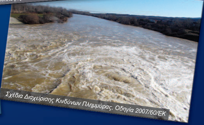
Σχέδια Διαχείρισης Κινδύνων Πλημμύρας, Οδηγία 2007/60/ΕΚ

NAMA Σύμβουλοι Μηχανικοί και Μελετητές ΑΕ Περρικού 32, 115 24 Αθήνα Τηλ. +30210 6974600 Fax. +30210 6983657 email: nama@namanet.gr web site: www.namanet.gr