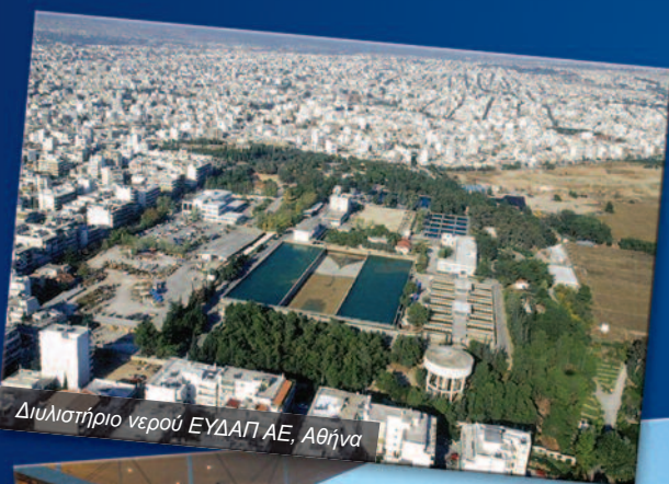
Διυλιστήριο νερού ΕΥΔΑΠ ΑΕ, Αθήνα

➔ Μελετάμε, Σχεδιάζουμε, Συμβουλευόμαστε για την βελτίωση των συνθηκών της ζωής μας